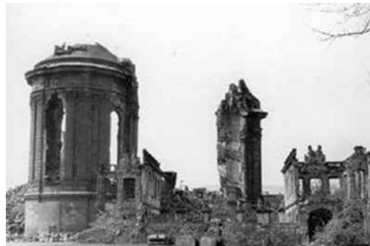
Die zerstörte Frauenkirche in Dresden – im sächsischen Jugendpfarramt entstand 1980 die Idee zur Friedensdekade in der DDR

In West- und Ostdeutschland wurde die Idee gleichzeitig im Jahre 1980 aufgenommen.